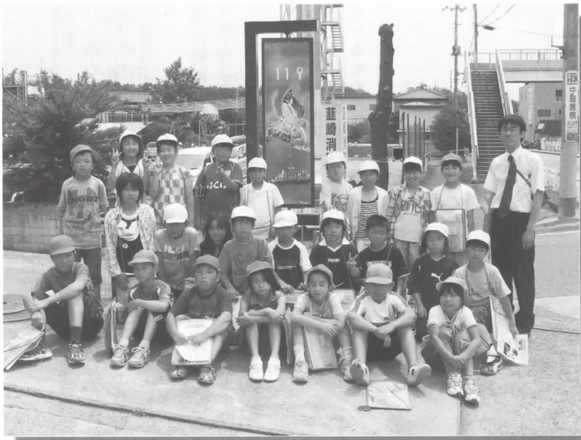
社会科見学(北杜市明野小学校4年生) 6月19日 見学