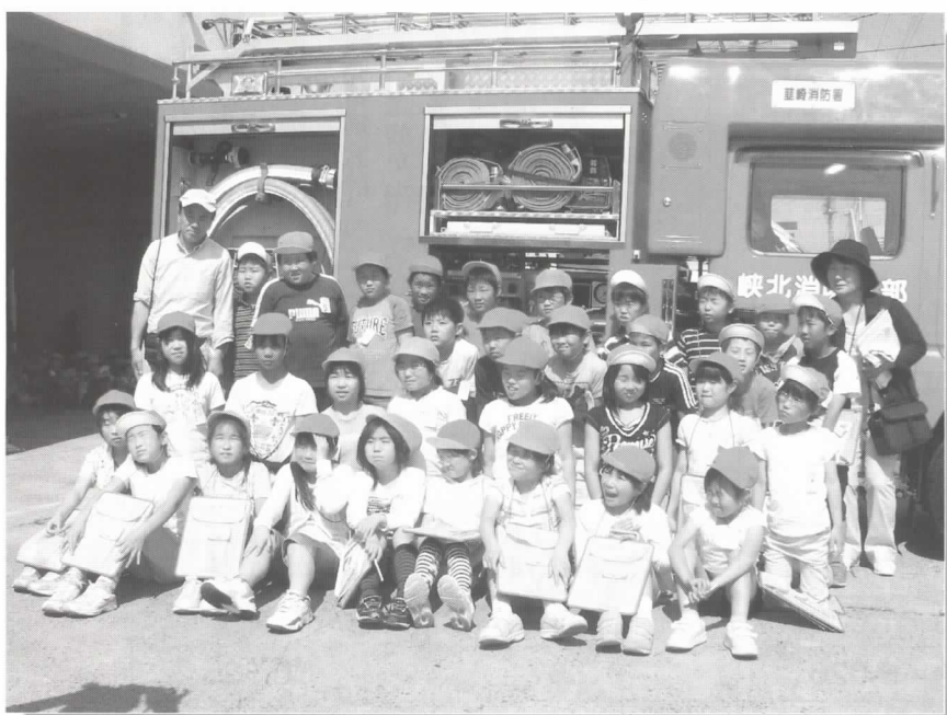
社会科見学(韮崎市韮崎北東小学校4年生) 5月27日 見学