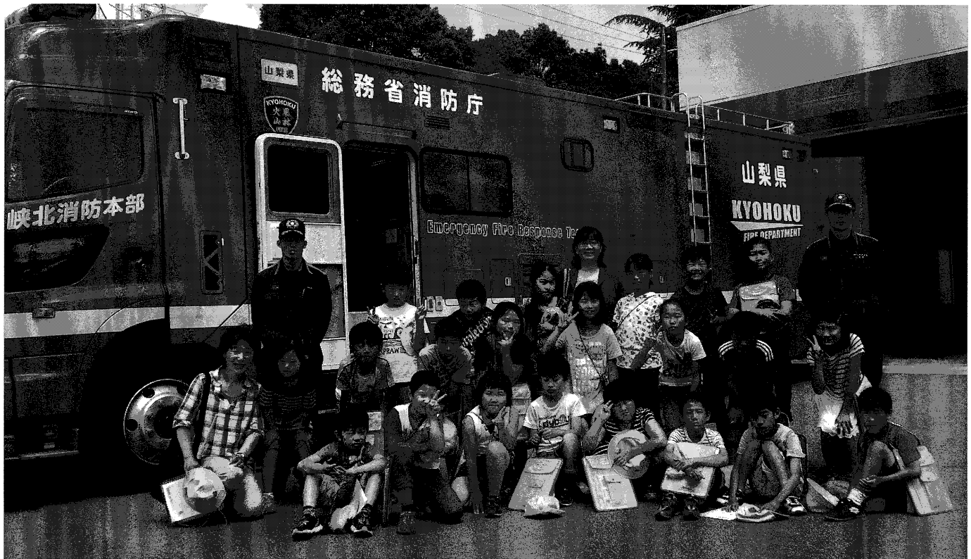
社会科見学 北杜市立高根東小学校4年生の皆さん

峡北広域行政事務組合 発行 山梨県韮崎市本町四丁目9-48 ☎ 0551-22-3311 編集/総務課 URL http://www.kyohoku-koiki.jp/