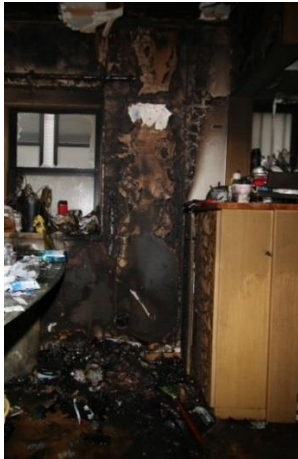
写真 1-2 焼損した電池