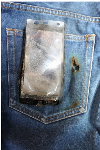
写真 2-2 スマートフォンの焼損状況