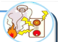
・自動火災報知設備