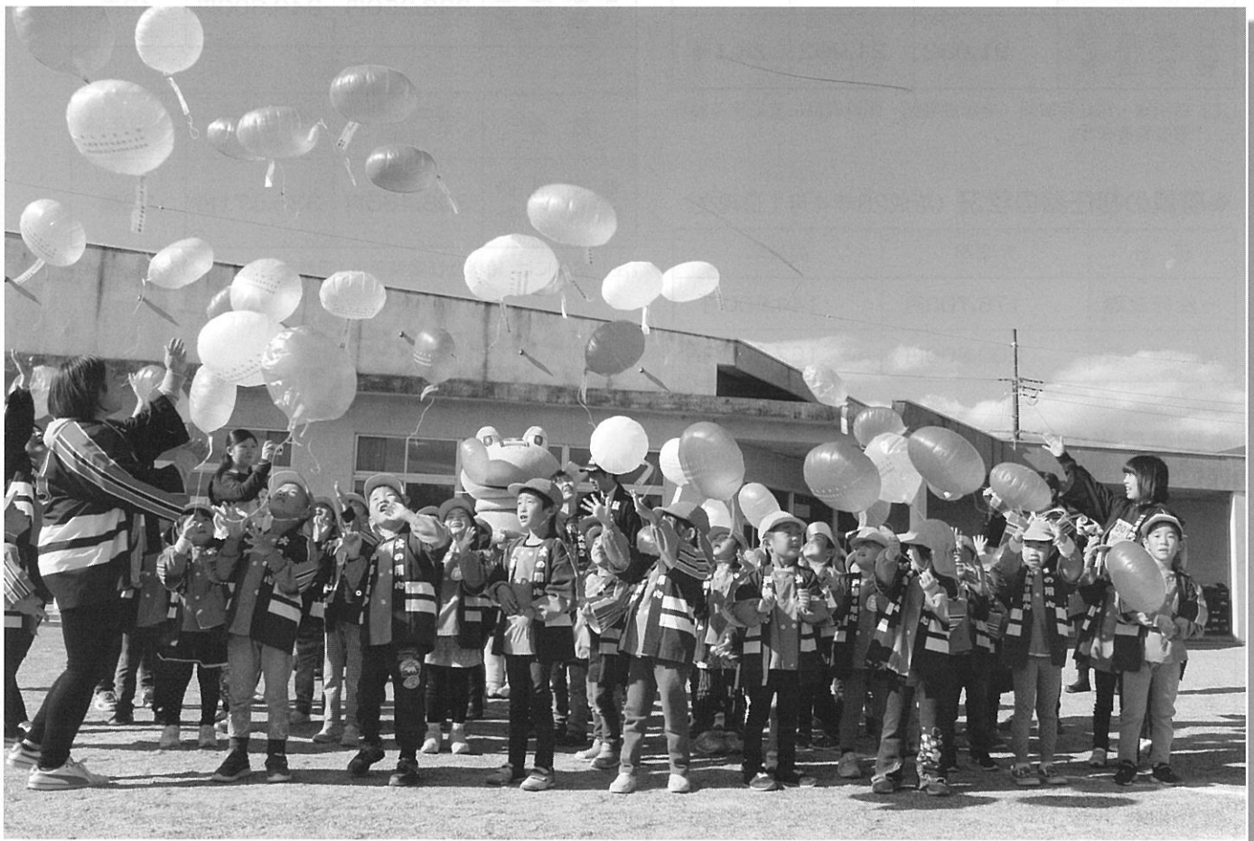
秋の火災予防運動 ～韮崎市立韮崎東保育園児の皆さん～

峡北広域行政事務組合 発行 山梨県韮崎市本町四丁目 8-36 ☎ 0551-22-3311 編集/総務課 URL http://www.kyohoku-koiki.jp/