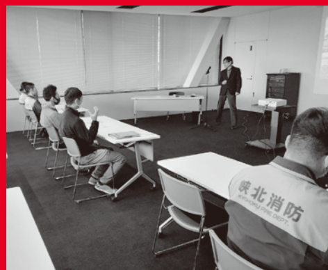
手話通訳士を招き 救急隊員が手話を学びました