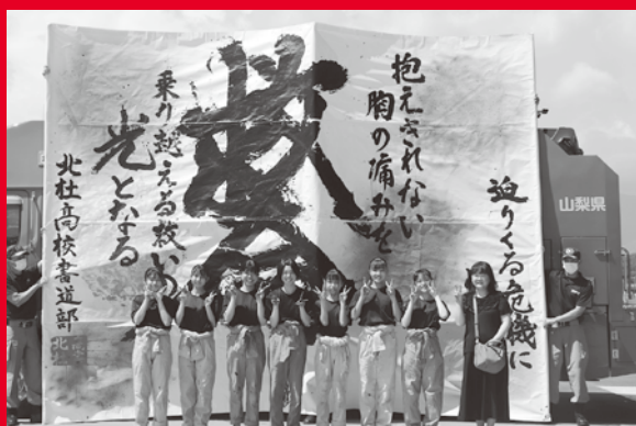
北杜高校書道部から 救急活動に対しエールが 送られました