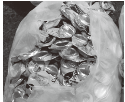
実際に持ち込まれたもえないごみの袋

しかし、不燃ごみとして持ち込まれた物には飲料のアルミ缶だけの袋も多数見受けられますので、このような不燃ごみは資源ごみとして出すことでごみの減量が可能になります。