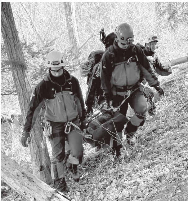
山岳遭難救助訓練の様子

このような困難な事案にも対応できるよう、本部救助隊員は定期的に訓練を行い、隊の能力向上と隊員間の連携強化を図っています。これからも市民の安全安心な生活が送れるよう努めてまいります。