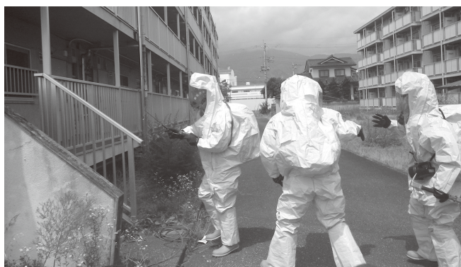
危険物質等漏えい、流出事故対応訓練の様子