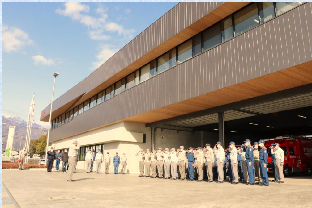
令和6年2月28日（水）訓練実施風景

今後も継続して合同訓練を実施し、お互いのスキルアップや連携強化を図り、住民皆様の安全と安心を守っていきます。