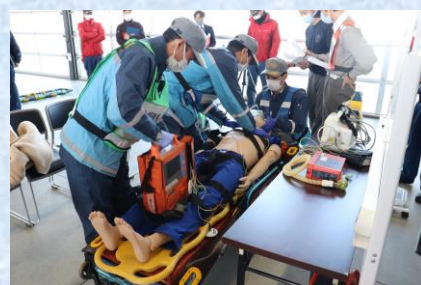
令和6年2月29日（木）訓練実施風景