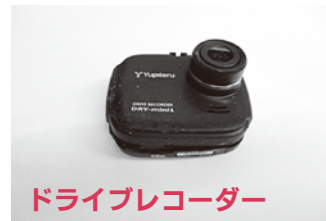
ドライレコーダー