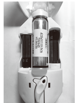
消臭センサー&スプレー