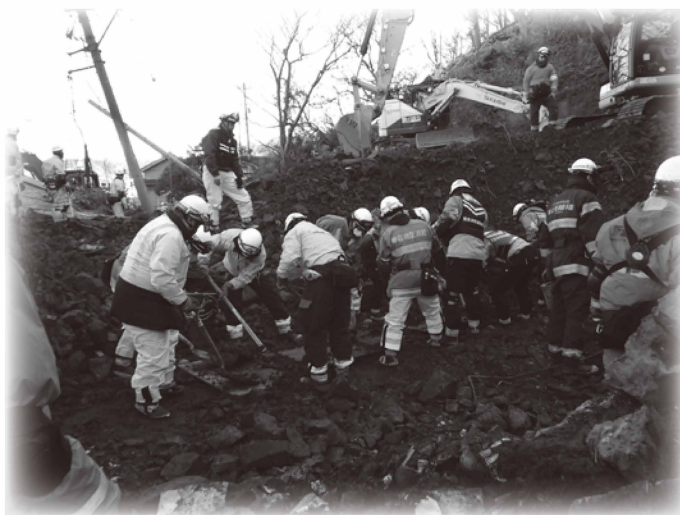
土砂崩れによる家屋倒壊現場での活動

当組合では被災地の復興を願うとともに、この経験を地域の安心に繋げられるよう努めてまいります。