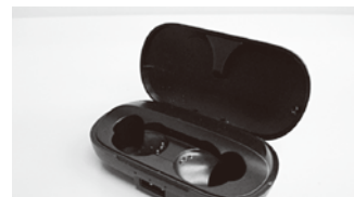
ワイヤレスイヤホン