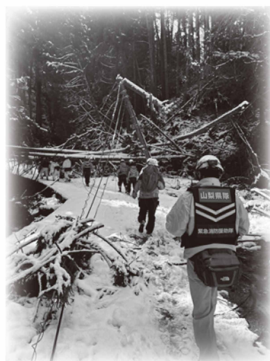
孤立集落の安否確認活動