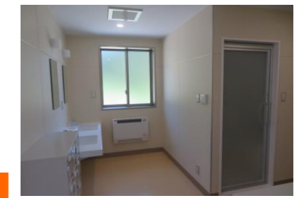
洗面・洗濯・脱衣室